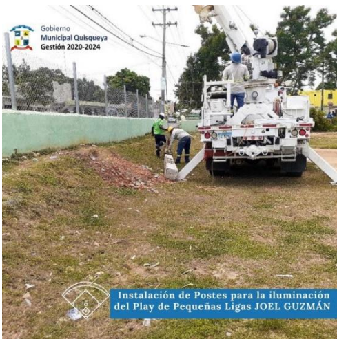
Instalación de Postes para la iluminación del Play de Pequeñas Ligas JOEL GUZMÁN

•DEPORTE• Cumpliendo con los compromisos en mejorar las condiciones de las instalaciones deportivas de nuestro municipio. Se inician los trabajos de instalación de postes para la iluminación del Play de Pequeñas Ligas “JOEL GUZMÁN “ donde también se realizará el acondicionamiento de las Gradas y la construcción de un dugout. Concretando acciones para un play óptimo para nuestros deportistas.