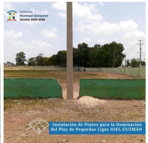
Instalación de Postes para la iluminación del Play de Pequeñas Ligas JOEL GUZMÁN