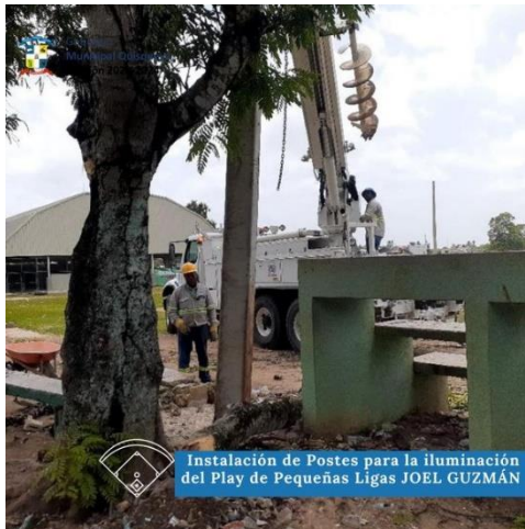
Instalación de Postes para la iluminación del Play de Pequeñas Ligas JOEL GUZMÁN